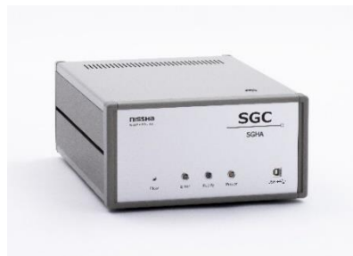
SGC ® (SGHA-P3-A1)

SGC ® は、カラムにオリジナルカラム、検知器に高感度半導体式ガスセンサーを用いることにより、高速分離と高感度計測を実現した、弊社独自のガスクロマトグラフです。