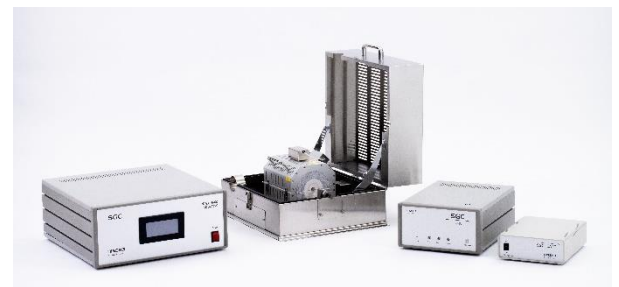
PDHA-1000, 2000, 3000 (共通)