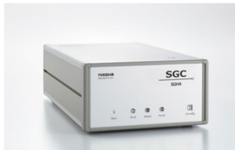
SGC ® (SGHA-P3-A1)

SGC ® は、カラムにオリジナルカラム、検知器に高感度半導体ガスセンサーを用いることにより、高速分離と高感度計測を実現した、弊社独自のガスクロマトグラフです。