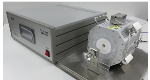
昇温制御装置、昇温炉 (SDS-P3-S, SDS-P3-R)